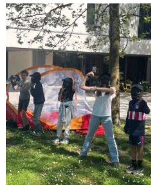
Vacances d'avril des jeunes 11-13ans