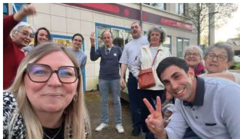
Comptoir des Bénévoles lors du concert du 20 mars au Mascaret