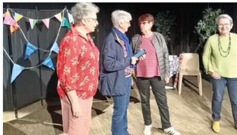
Contes pour les centres de loisirs lors des vacances d'avril