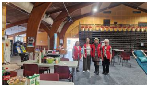
Collecte pour le don du sang